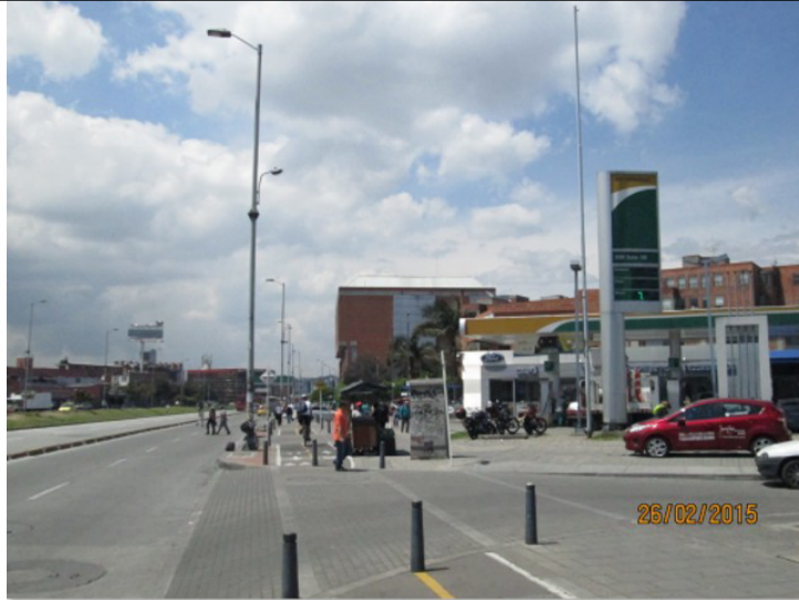
Foto 2. Vista del predio en donde estaba ubicado el elemento en la Av. Suba No. 97 -04 (dirección catastral) tomada del concepto técnico 00238 de 2016.